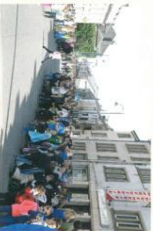
La toute grande foule était présente pour voir...

Gaume !!!... et à tout le moins la capitale de la tradition carnavalesque !!! On n'insiste pas assez sur la nécessaire implication des confrères dans la vie de la cité! L'exemple de Jean-Marie vient à point !!!