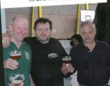
... et le lundi ??? →