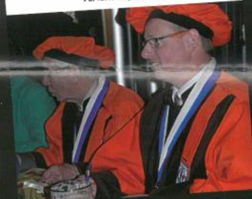
Par ici les diplômés...