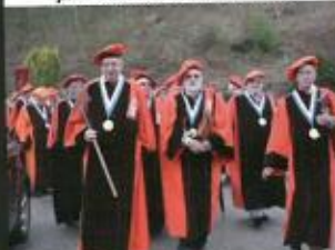
En route pour le 37 e ! Accélérons pour passer à côté d'une averse !