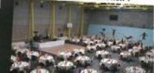
Une vue de la salle... Impressionnant non ?