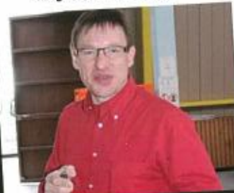
Malgré l'orval de la veille, →