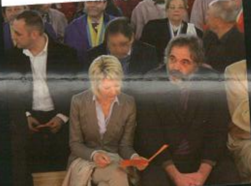
Les candidats à l'intronisation impatients de monter sur le podium ? Ou inquiets ?