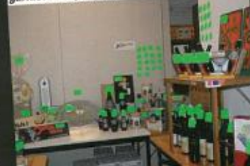
Vue (partielle) des lots d'une tombola bien garnie... Super pour les « récolteurs de lots »