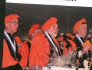
Tchantant, tchantant !