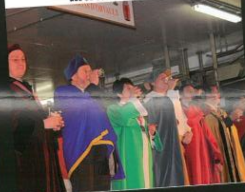
Aperçu de quelques représentants des 30 Confréries présentes !