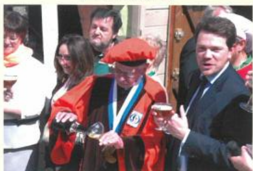
L'Orval d'honneur après le défilé ! Les français sont aussi amateurs de notre breuvage !