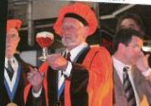
Le Grand « gousteur », toujours aussi sérieux !