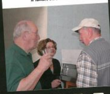
il fallait être là !!! →