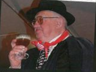
Bonne santé, le Doyen des Cotéries !!! 83 ans... le « Lev'go » conserve aussi bien que l'Orval !