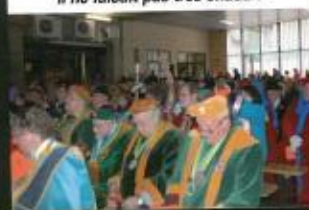
Assistance... plus ou moins attentive... et peut-être pressée d'en finir... il ne faisait pas très chaud !